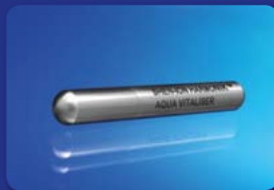
SHEN-ION HARMONIK™ Aqua-Vitaliser Stick