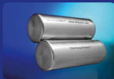
SHEN-ION HARMONIK™ Aqua-Vitaliser Maxi