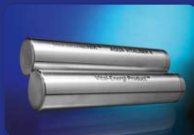
SHEN-ION HARMONIK™ Aqua-Vitaliser II