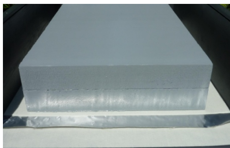
RadonProtect Folie System unter der Bodenplatte