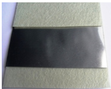
RadonProtect Folie mit Wikaflor Schutzvlies

Unter und über der RadonProtect Folie wird je eine Lage Wikaflor Schutzvlies im „Sandwich“-Verfahren verlegt. Mechanische Beschädigungen sind unbedingt zu vermeiden. Die RadonProtect Folie soll möglichst kurzfristig vor der Estrich-Verlegung eingebaut werden. Es ist darauf zu achten, dass keine Löcher und Risse durch Bauaktivitäten entstehen.