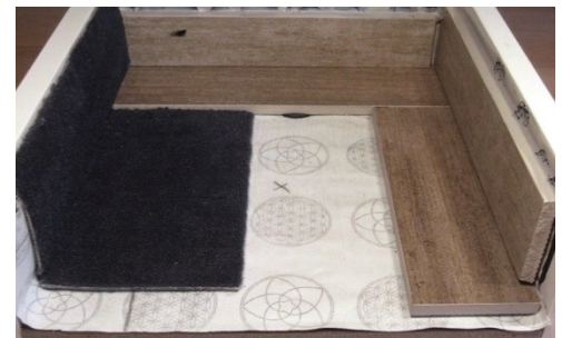
Feng Shui Spiegelfolie VLIES unter verschiedenen Bodenbelägen

Hinweis: Sämtliche Arbeitsschritte sind mit den zuständigen Architekten und Fachplanern abzustimmen.